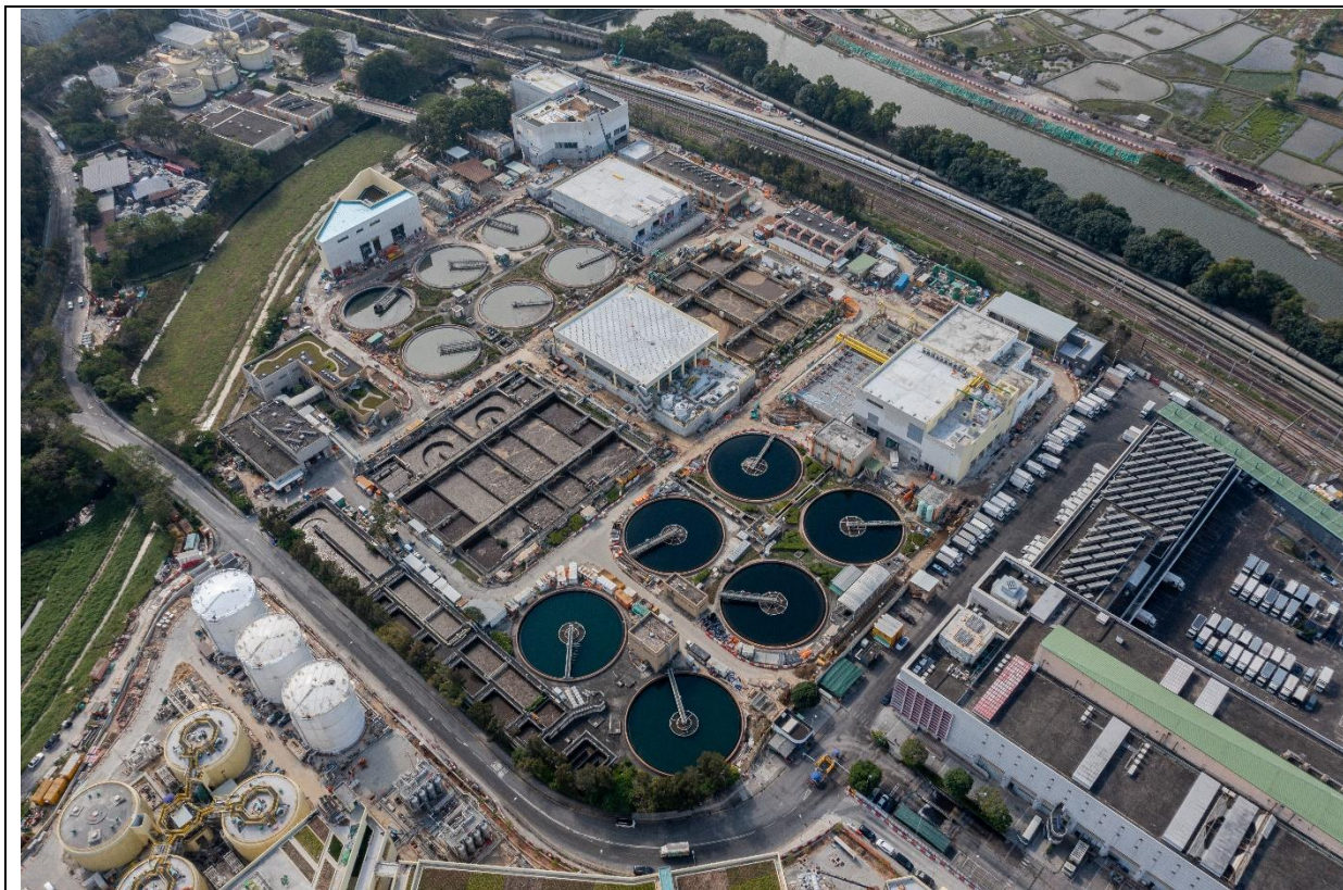
描述： 工地甲部分及乙部分的航拍照片 (拍摄于2024年12月13日)