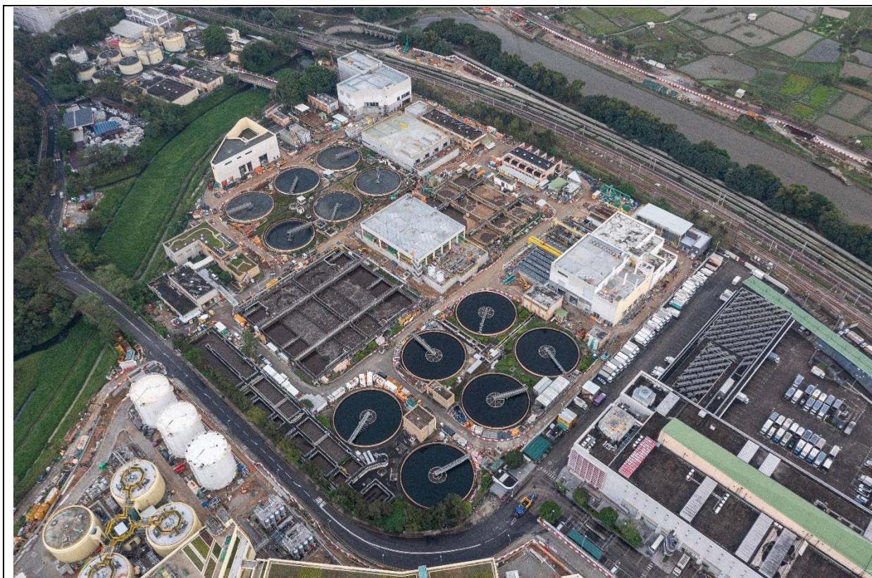
描述： 工地甲部分及乙部分的航拍照片 (拍摄于2024年11月17日)