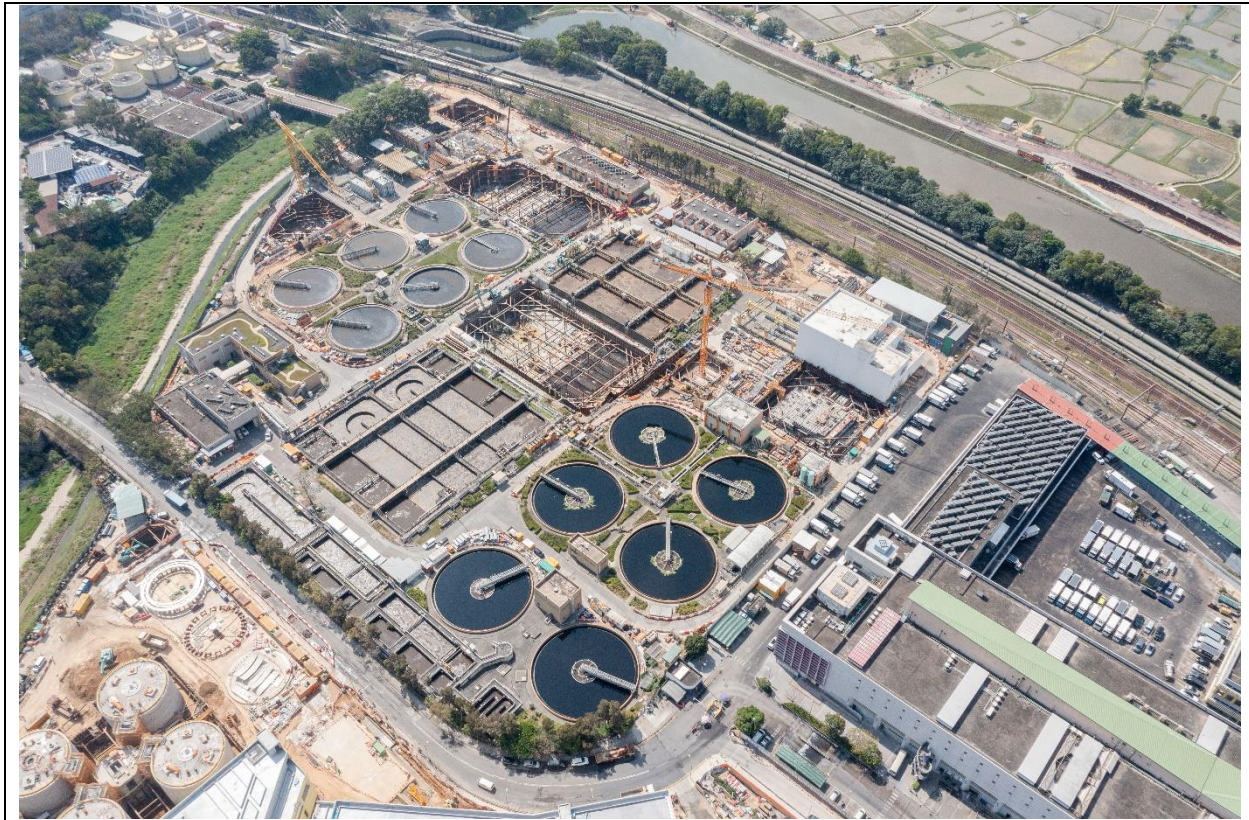
描述： 工地甲部分及乙部分的1號航拍照片 (拍攝於2023年2月16日)