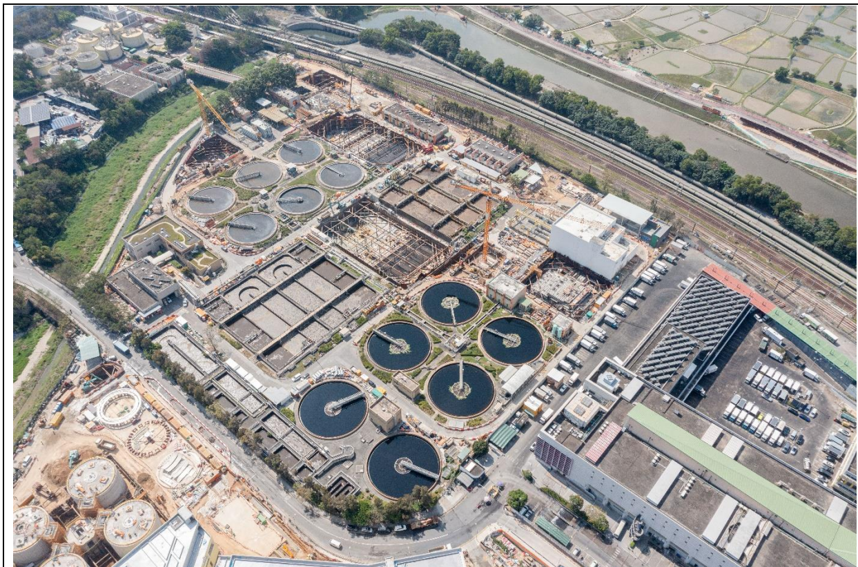
描述： 工地甲部分及乙部分的1号航拍照片 (拍摄于2023年2月16日)