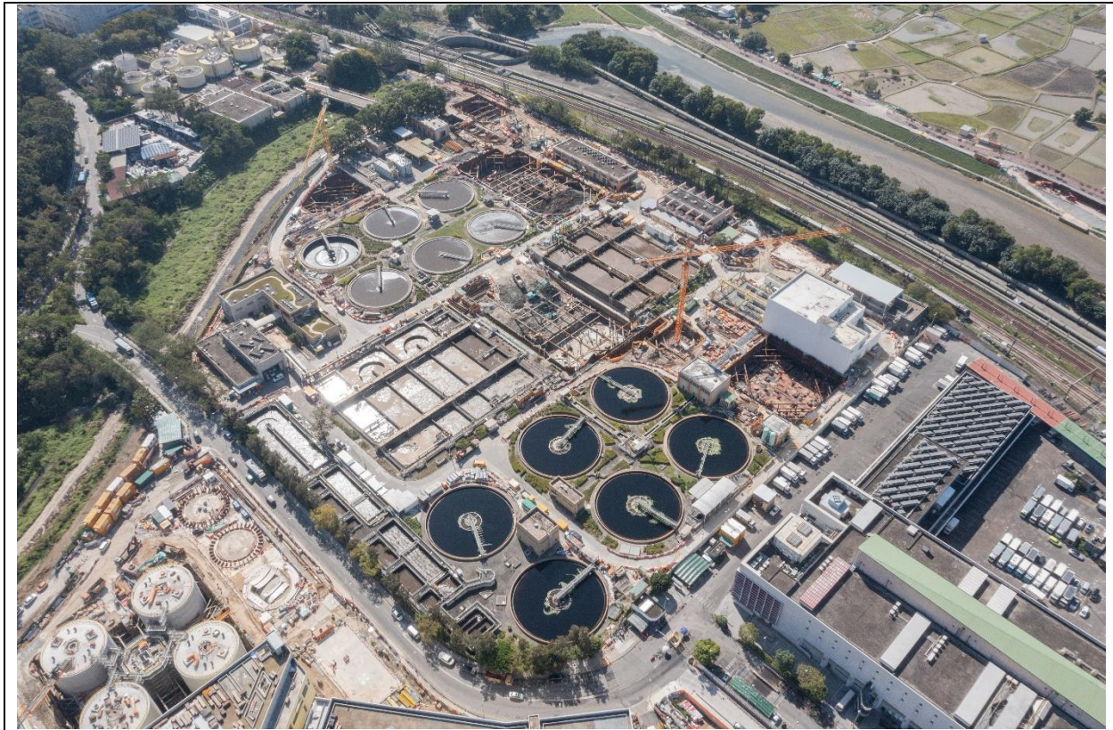
描述： 工地甲部分及乙部分的1號航拍照片 (拍攝於2022年12月19日)