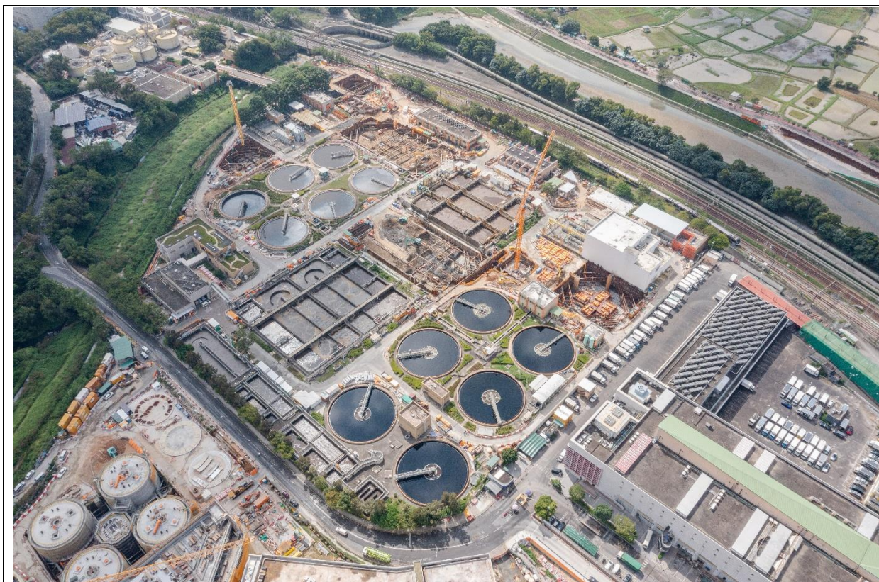
描述： 工地甲部分及乙部分的1号航拍照片 (拍摄于2022年11月18日)