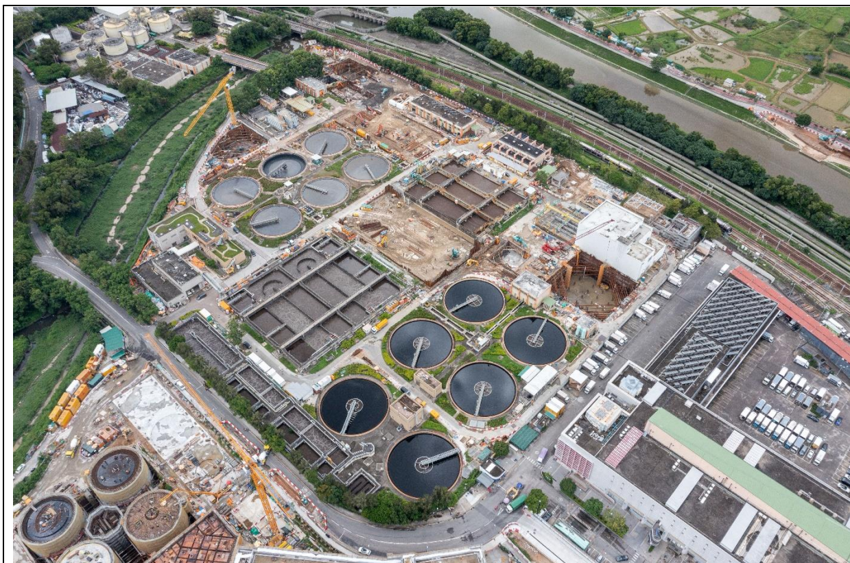
描述： 工地甲部分及乙部分的1号航拍照片 (拍摄于2022年8月19日)