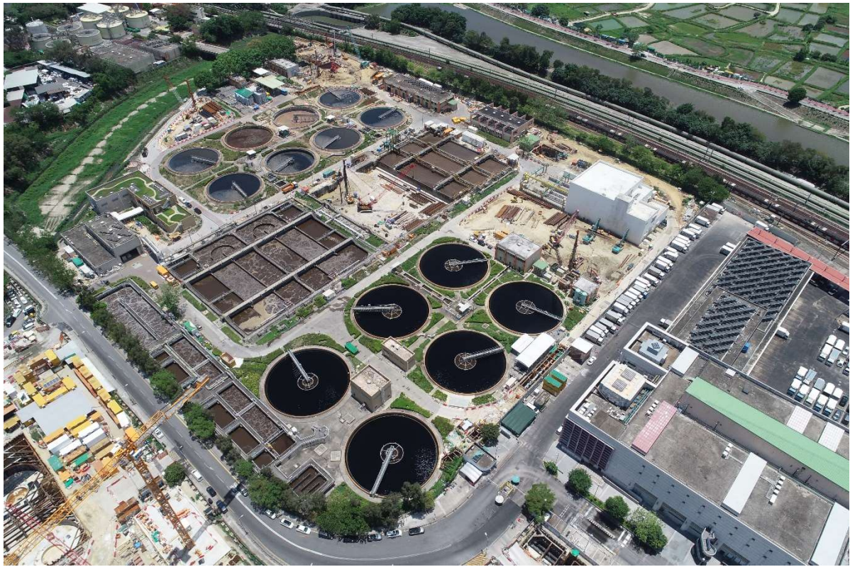
描述: 工地甲部分的1號航拍照片 (拍攝於2021年5月18日)