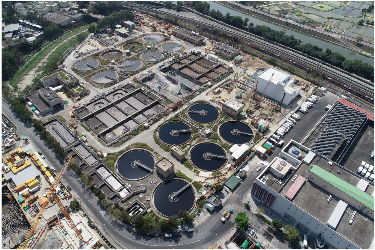
描述: 工地甲部分的1號航拍照片 (拍攝於2021年2月18日)