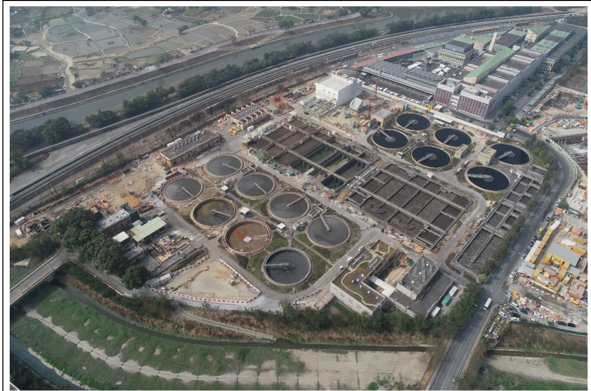
描述: 工地甲部分的1號航拍照片 (拍攝於2021年1月26日)