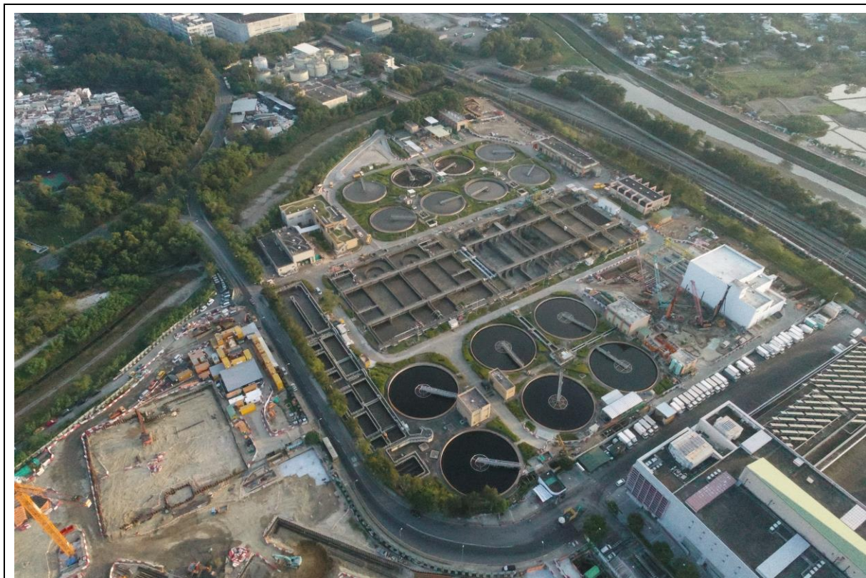
描述: 工地甲部分的1号航拍照片 (拍摄于2020年10月30日)