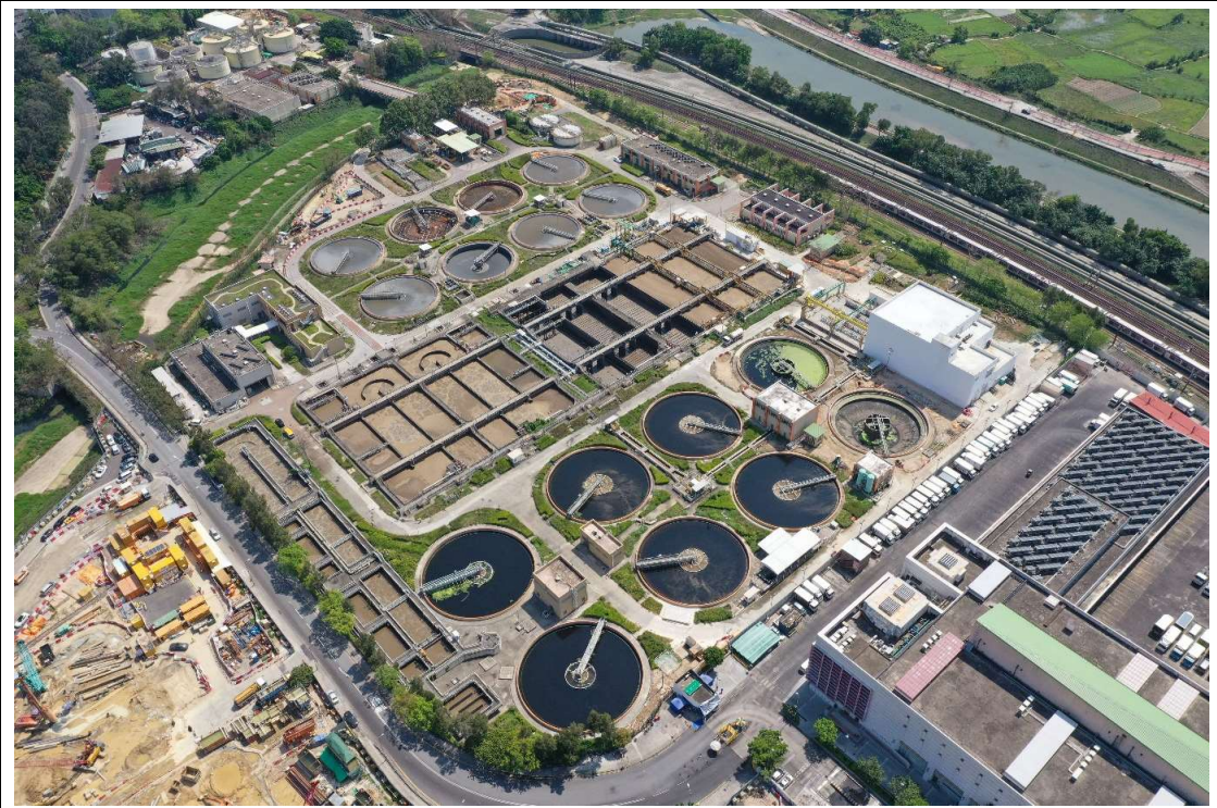
描述: 工地甲及乙部分的1號航拍照片(拍攝於2020年3月25日)